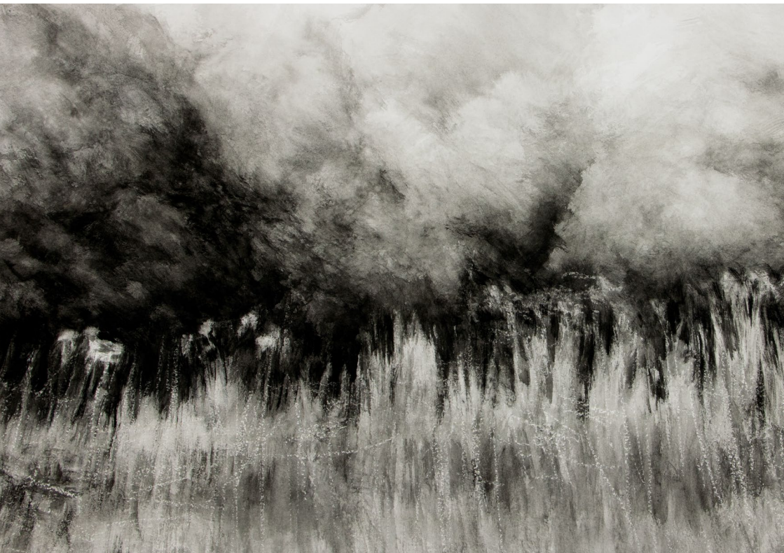
Mathieu Wüthmann, La Grande Prairie et ses ombellifères , 2023, gouache, acrylique et cire d'abeille sur papier, 57 x 76 cm.