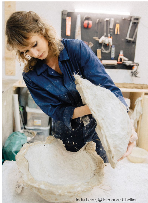
India Leire, © Éléonore Chellini.

« Dans cette sculpture, mon intention est de capturer de manière authentique la profonde connexion qui existe entre les arbres lorsqu'ils se balancent gracieusement au gré du vent, orchestrant une symphonie envoûtante de feuilles bruissantes. [...] Au cœur de chaque arbre réside un écosystème vibrant et complexe, servant de sanctuaire et de nourriture à une diversité d'êtres vivants, tant végétaux qu'animaux. [...] Cette sculpture sert de témoignage à la conversation souvent invisible qui se déroule entre les arbres, un dialogue silencieux transmis à travers le réseau complexe de mycéliums cachés sous le sol forestier. [...] De plus, le choix de créer cette pièce à partir de branches soigneusement collectées dans leur environnement naturel sert de rappel délibéré du partenariat entre l'humanité et le monde naturel, soulignant notre responsabilité en tant que gardiens, veillant à préserver cet équilibre délicat, garantissant le bien-être de notre planète. » Extrait de la note d'intention du projet d'India Leire