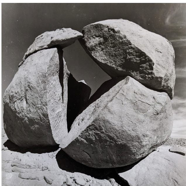
Lorand Gaspar, Détails d'une chapelle à Lindos