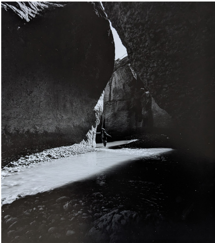
Wadi Hasa, Transjordanie