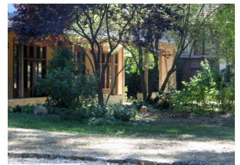
Ateliers et différentes œuvres d'artistes ayant exposé au Tournefou.