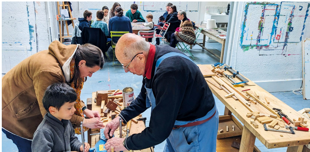
Atelier de M. Renaudot proposé par l'association l'Outil en main, 2024.