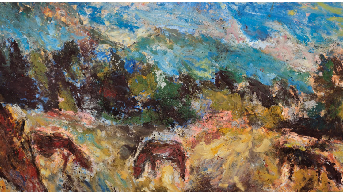
Vincent Bebert, « Chevaux et montagnes », 2017, huile et tempera sur papier marouflé, 122 x 250 cm.